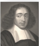
Baruch de Spinoza niederländischer Philosoph (1632-1677)

Ein Verwandter ist ein Teil unseres Leibes, ein Freund ein Teil unserer Seele.